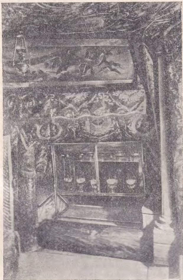
ВИФЛЕЕМ. ПЕЩЕРА БАЗИЛИКИ РОЖДЕСТВА ХРИСТОВА. ЯСЛИ ХРИСТОВЫ

маленькой ниши стоят две колонны, а свод ее, также как и в большой пещере, завешан парчевыми пеленами. В глубине яслей под сводом висят лампы. Так как многие паломники в свое время откалывали себе кусочки от каменной породы яслей, то пришлось в целях сохранения яслей заложить их спереди каменным брусом, закрыть плитой самое ложе и защитить ясли стеклом. Впрочем у левой колонны за стеклом оставлена видимой для глаз часть породы яслей.