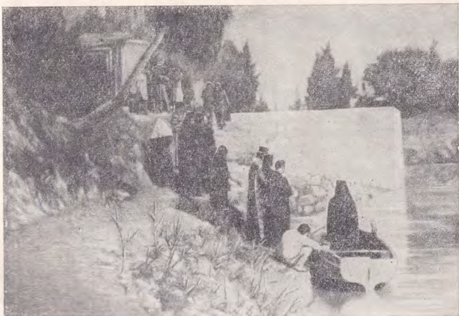
ИОРДАН. ЧЛЕНЫ ПАЛОМНИЧЕСКОЙ ГРУППЫ СОВЕРШАЮТ БОГОЯВЛЕНСКОЕ ВОДООСВЯЩЕНИЕ

По заведенному на Иордане обычаю, паломники совершают там великое, или богоявленское водоосвящение с пением «Во Иордане крещаящуся Тебе, Господи...», берут с собой освященную воду, а многие и погружаются в реку. Так сделали и мы.