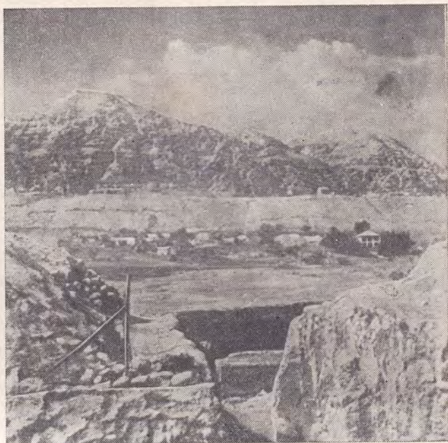
ИОРДАНСКАЯ ПУСТЫНЯ. НА ГОРИЗОНТЕ — ГОРА СОРОКАДНЕВНОГО ИСКУШЕНИЯ. НИЖЕ — СЕЛЕНИЕ ЭР-РИХА (ДРЕВНИЙ ИЕРИХОН)

На юго-восточном склоне этой горы, много ниже вершины ее, стоит греческий монастырь, восстановленный в прошлом столетии Святогробским братством. Кто и когда положил начало этому монастырю, неизвестно. Монастырь стоит над обрывом, у глубокого ущелья. Ниже и выше монастыря в весьма отвесных склонах горы зияют пещеры, когда-то заселенные христианскими отшельниками. Теперь в монастыре живут четыре монаха. Мы подъехали к подножию этой горы. Отсюда до