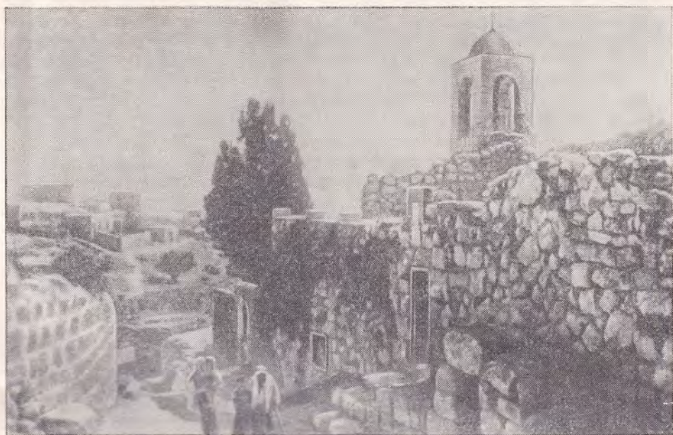
ЭЛЬ-АЗАРИЕ (ДРЕВНЯЯ ВИФАНИЯ). СПРАВА МЕЧЕТЬ НА МЕСТЕ СООРУЖЕННОЙ КРЕСТОНОСЦАМИ ЦЕРКВИ БЛИЗ ГРОБНИЦЫ СВ. ЛАЗАРЯ. ВНИЗУ — ВХОД В ГРОБНИЦУ СВ. ЛАЗАРЯ

Евангелии, хочется сказать несколько слов об Акелдаме, или Земле крови, которую купили первосвященники на деньги, брошенные Иудой (Мф. 27, 3—10). Это место, как уже было сказано, находится на мысе, образуемом при слиянии долины Гееннской с Кедроном. Вплоть до эпохи крестоносцев оно служило кладбищем для паломников. В настоящее время все эти могилы-пещеры почти сравнялись с землей и на их месте стоит православный греческий монастырь преп. Онуфрия Афонского. Но как сказал евангелист Матфей, «...и называется земля та землей крови до сего дня» (Мф. 27, 8), так, действительно, до настоящего времени это место сохраняет свое название, и на всех картах Иерусалима, во всех справочниках-путеводителях для гидов и туристов вы читаете вызывающее в вас тяжелое чувство слово «Акелдама».