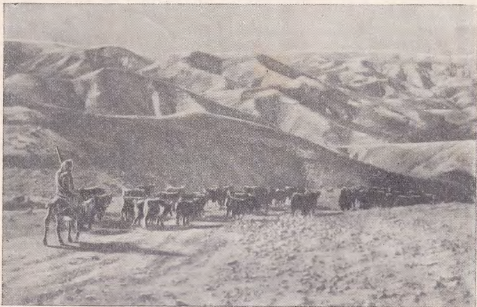
ОБЩИЙ ВИД ИОРДАНСКОЙ ПУСТЫНИ (Гряда песчано-известковых холмов)

равнину грандиозных размеров. Не такова Иудейская пустыня. Это — гряда песчано-известковых холмов, которые возвышаются один над другим, так что термин горизонт, как понятие небосклона, в данном случае едва ли будет удачным, потому что взгляд человека здесь видит в первую очередь нагромождающиеся выше и выше холмы, а не небо, опускающееся над далью земной поверхности. Эти бесконечные холмы лишены растительности. Нет на них ни дерева, ни кустика, лишь кое-где растет жалкая трава. Нет здесь и жилья, и только изредка пройдет стадо овец, перегоняемое пастухами с одного горного пастбища на другое.