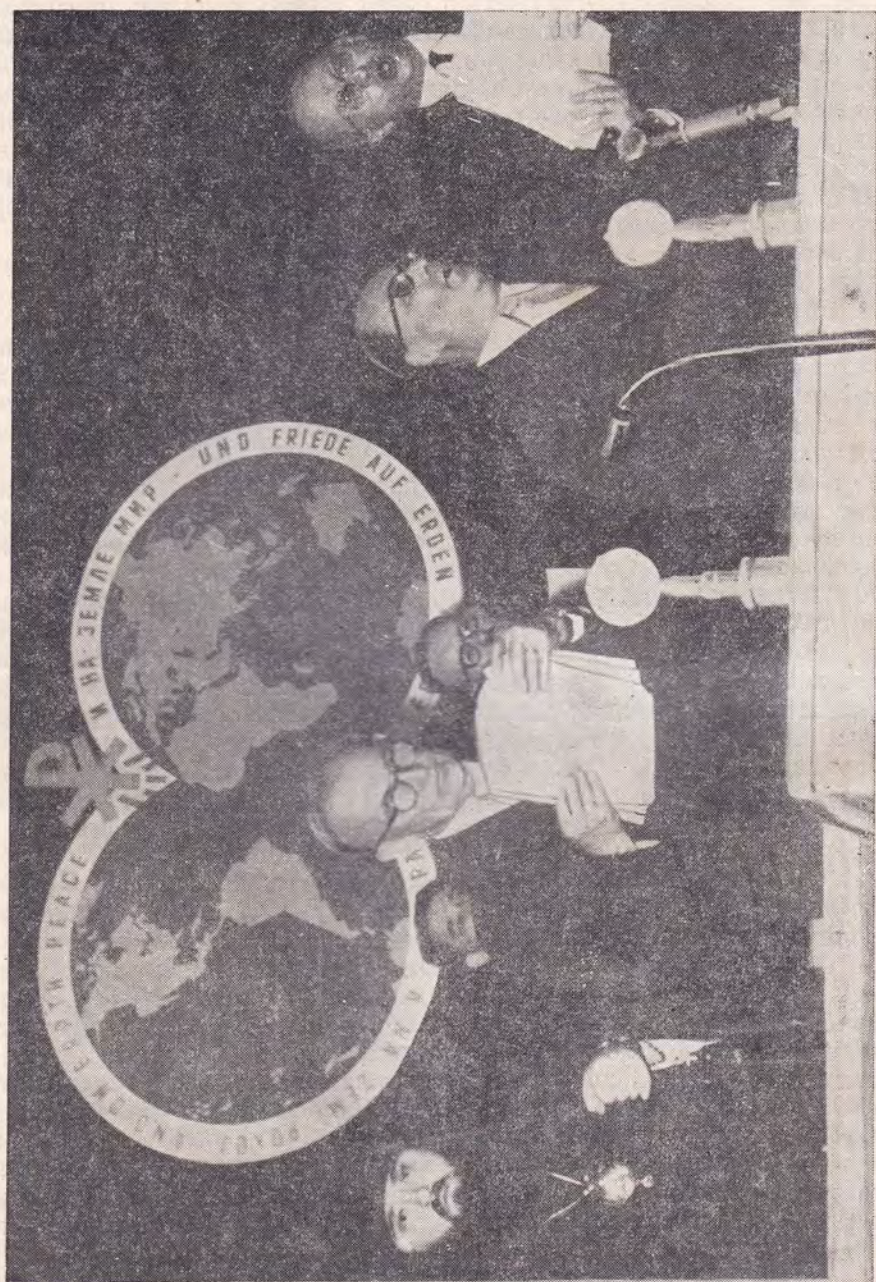
МОЛИТВА ПЕРЕД ОТКРЫТИЕМ ВСЕМИРНОГО ОБЩЕХРИСТИАНСКОГО КОНГРЕССА В ЗАЩИТУ МИРА