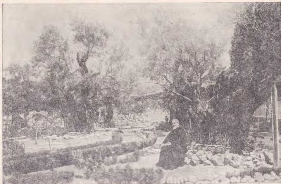
ГЕФСИМАНИЯ. ГИГАНТСКИЕ МАСЛИНЫ

говечное дерево. При правильном уходе за ней и обрезке ее ветвей, она может жить тысячелетия. Поэтому вполне возможно, что в этих гигантах мы видим отпрыски Гефсиманского сада,— где молился Христос,— тщательно оберегаемые в течение тысячелетий заботливыми руками людей, которым дорого было самое место этого сада; оливы заботливо оберегаются и теперь.