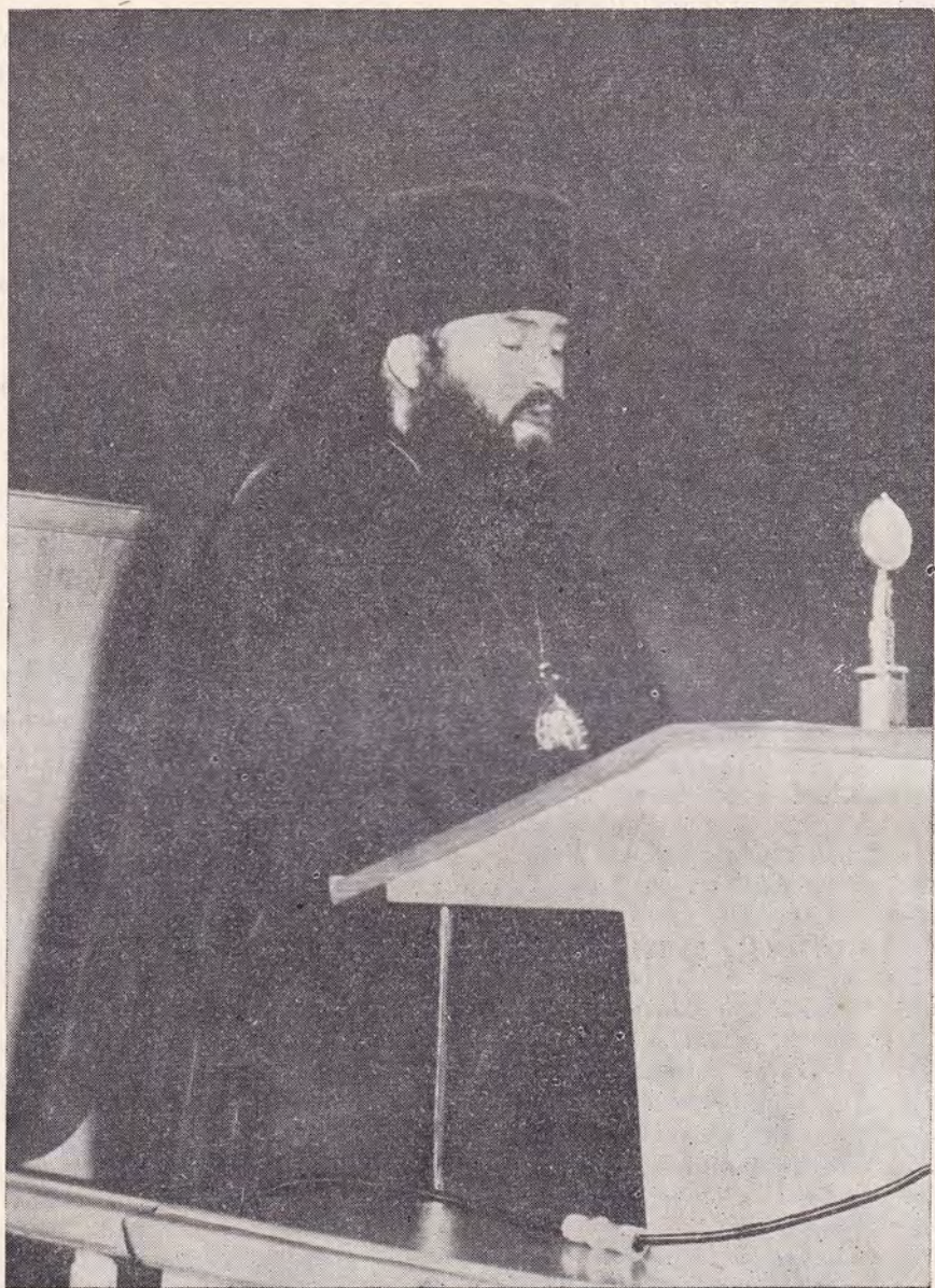
АРХИЕПИСКОП ЯРОСЛАВСКИЙ И РОСТОВСКИЙ НИКОДИМ ЧИТАЕТ ДОКЛАД ОТ РУССКОЙ ПРАВОСЛАВНОЙ ЦЕРКВИ