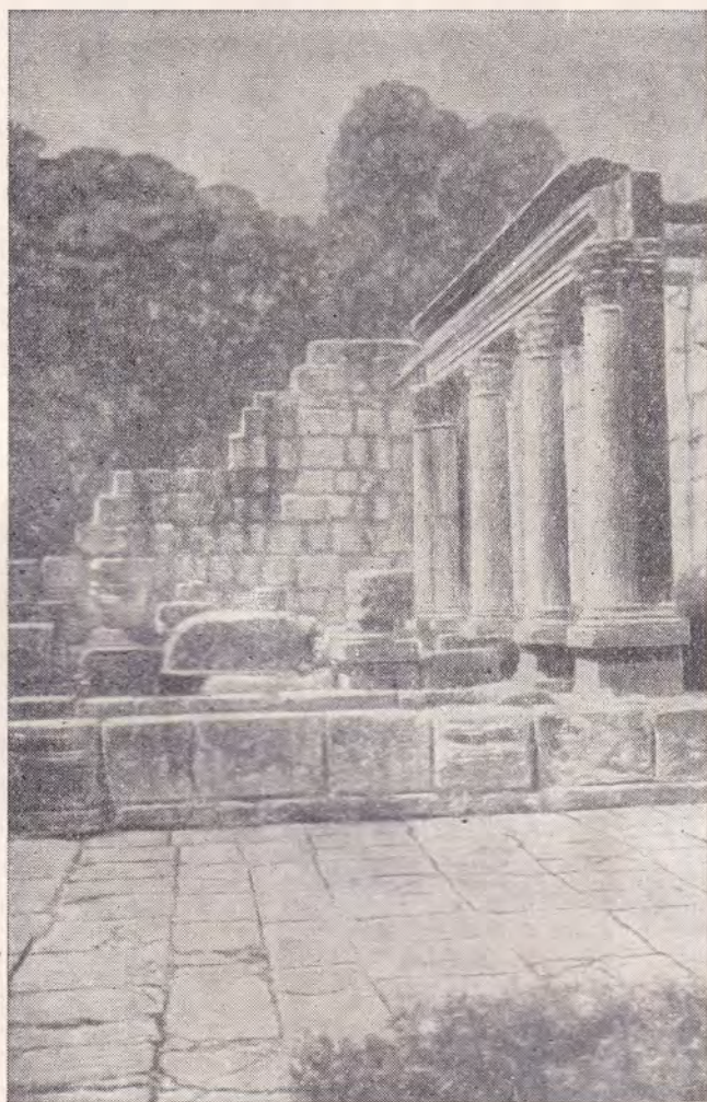
РУИНЫ КАПЕРНАУМСКОЙ СИНАГОГИ (После раскопок 1921 г.)

Обнаруженные близ развалин капернаумской синагоги руины христианского храма византийской эпохи служат свидетельством того, что