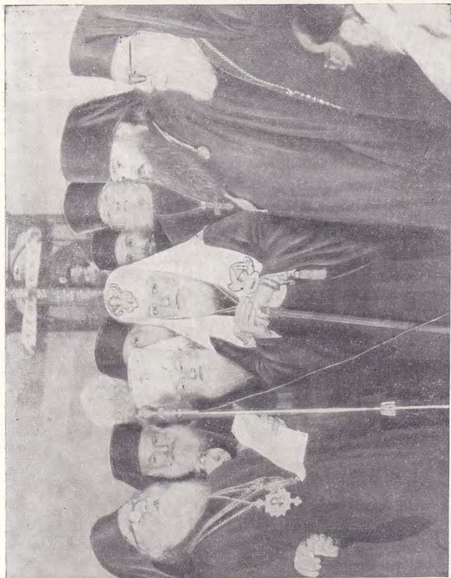
ДАМАСК. ПАТРИАРХ ФЕОДОСИЙ VI ПРОИЗНОСИТ ПРИВЕТСТВЕННОЕ СЛОВО ПРИ ВСТРЕЧЕ С ПАТРИАРХОМ АЛЕКСИЕМ В ПАТРИАРШЕМ СОБОРЕ