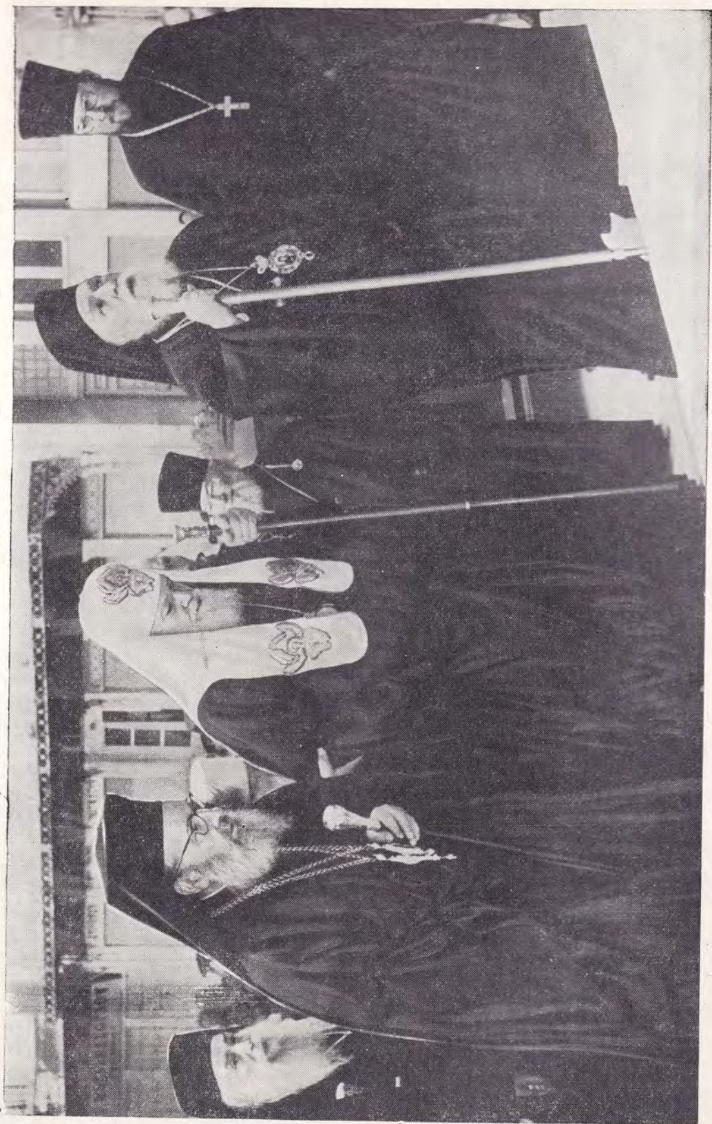
АФИНЫ, СВЯТЕЙШИЙ ПАТРИАРХ АЛЕКСИЙ И АРХИЕПИСКОП ФЕОКЛИТ ПРИ ВХОДЕ В КАФЕДРАЛЬНЫЙ СОБОР В ДЕНЬ ПРИБЫТИЯ В АФИНЫ