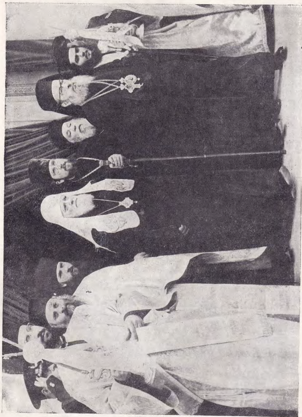
АФИНЫ. СВЯТЕЙШИЙ ПАТРИАРХ АЛЕКСИЙ И БЛАЖЕННЕЙШИЙ ФЕОКЛИТ, АРХИЕПИСКОП АФИНСКИЙ И ВСЕЯ ЭЛЛАДЫ, ПОСЛЕ БОГОСЛУЖЕНИЯ