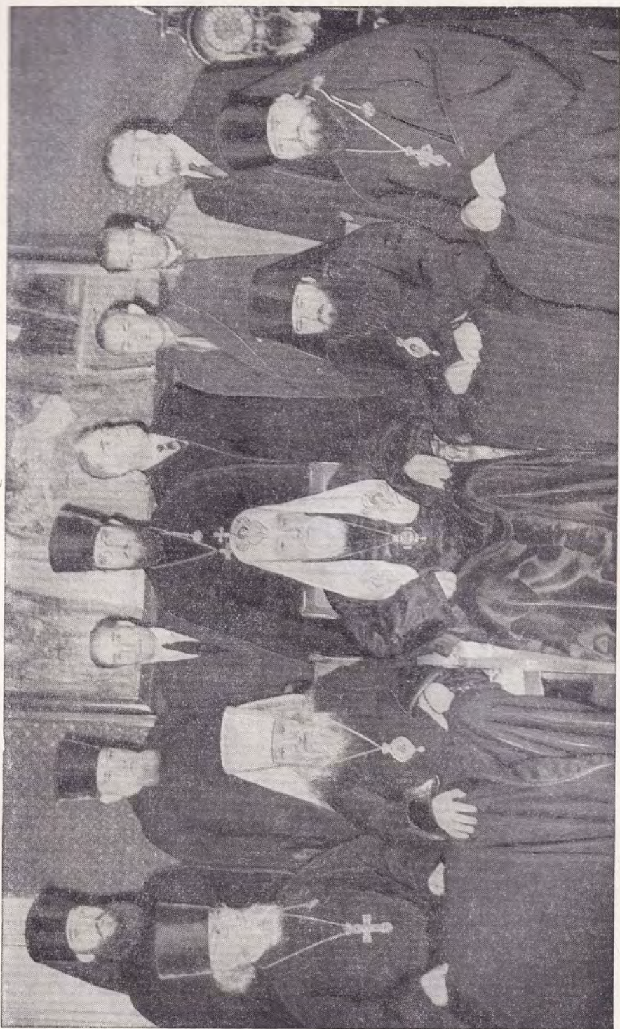
УЧАСТНИКИ ПАЛОМНИЧЕСКОЙ ПОЕЗДКИ В СТРАНЫ ВОСТОКА