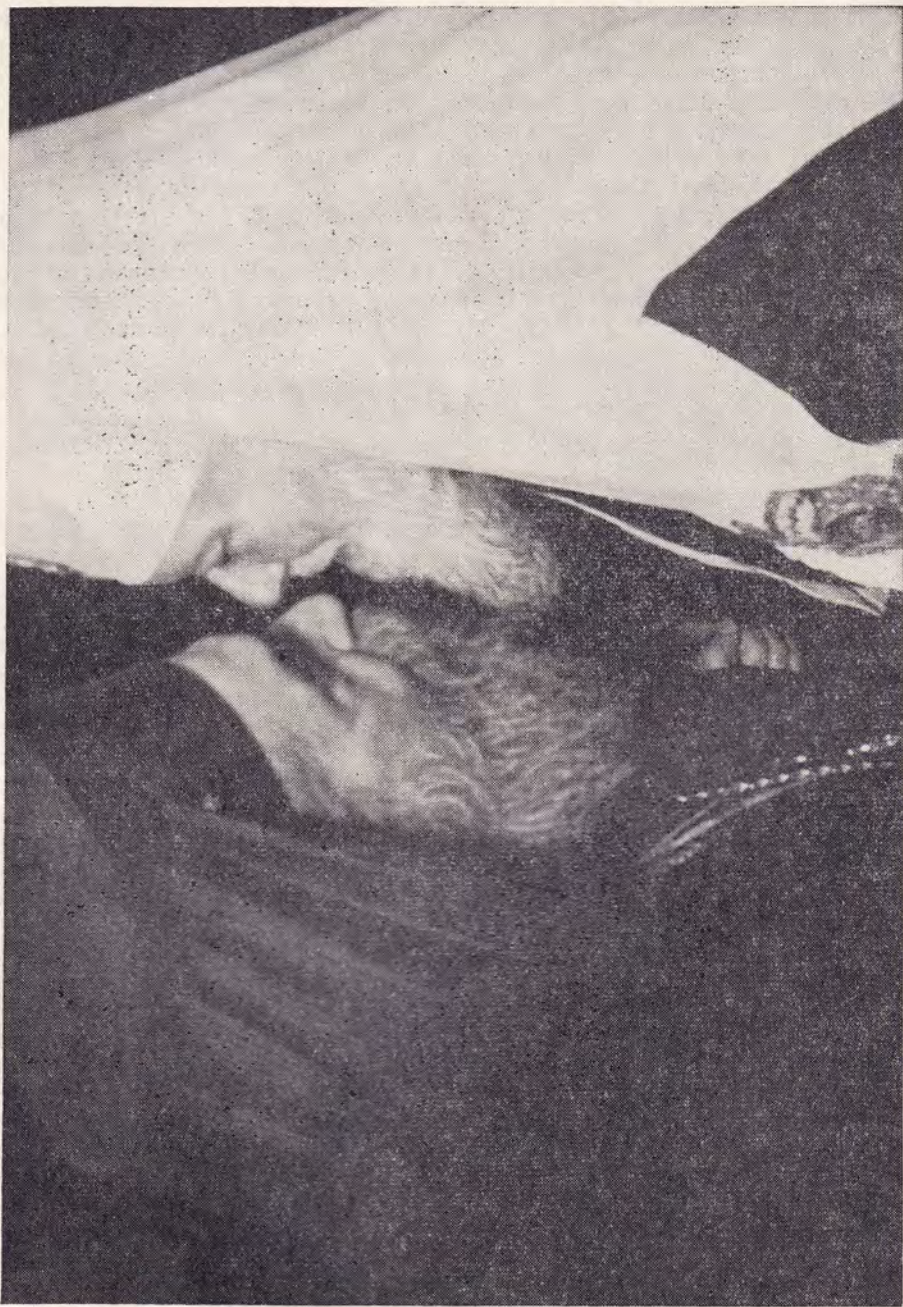
ИЕРУСАЛИМ. ВСТРЕЧА СВЯТЕЙШЕГО ПАТРИАРХА АЛЕКСИЯ С БЛАЖЕННЕЙШИМ ПАТРИАРХОМ ИЕРУСАЛИМСКИМ И ВСЕЯ ПАЛЕСТИНЫ ВЕНЕДИКТОМ I