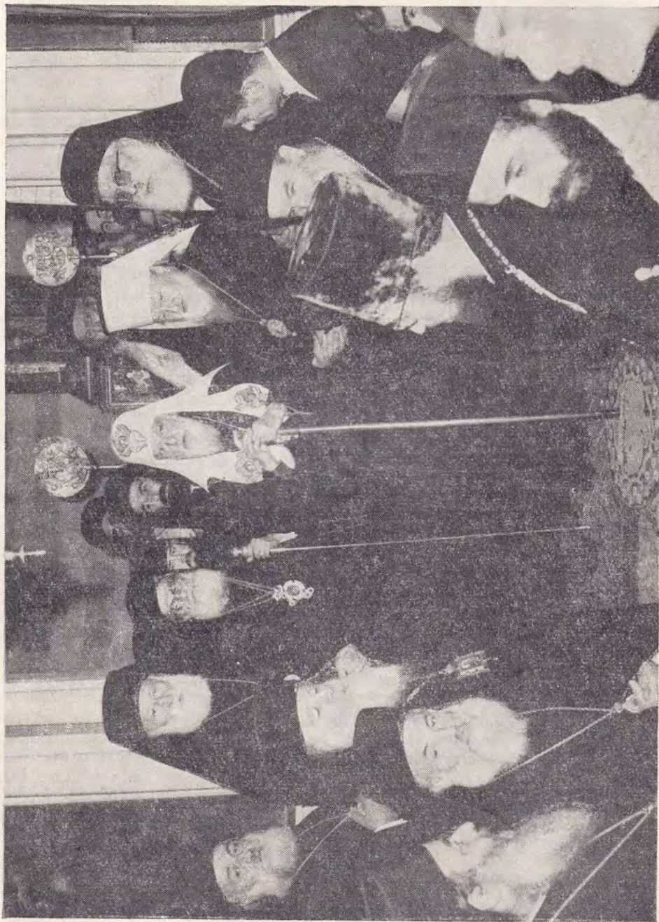
ДАМАСК. ВСТРЕЧА СВЯТЕЙШЕГО ПАТРИАРХА АЛЕКСИЯ В ПАТРИАРШЕМ КАФЕДРАЛЬНОМ СОБОРЕ