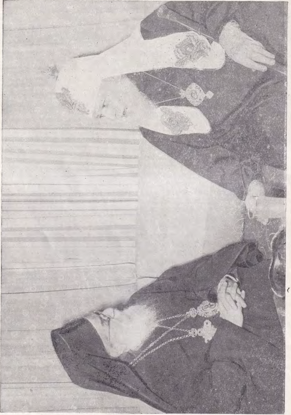
ДАМАСК. БЕСЕДА СВЕЯТЕЙШЕГО ПАТРИАРХА АЛЕКСИЯ С ПАТРИАРХОМ ФЕОДОСИЕМ