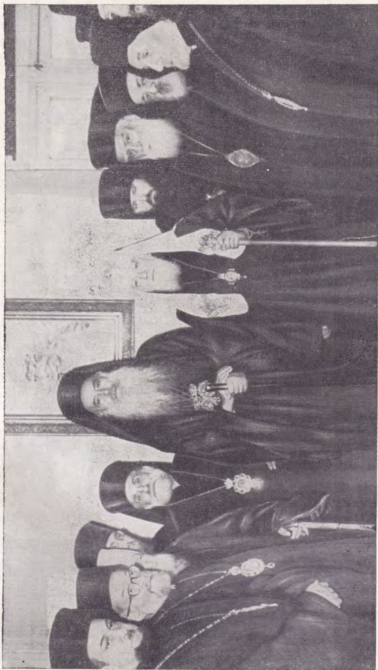
КОНСТАНТИНОПОЛЬ, СВЯТЕЙШИИ ПАТРИАРХ АЛЕКСИИ С ПАТРИАРХОМ АФИНАГОРОМ ПОСЛЕ БОГОСЛУЖЕНИЯ