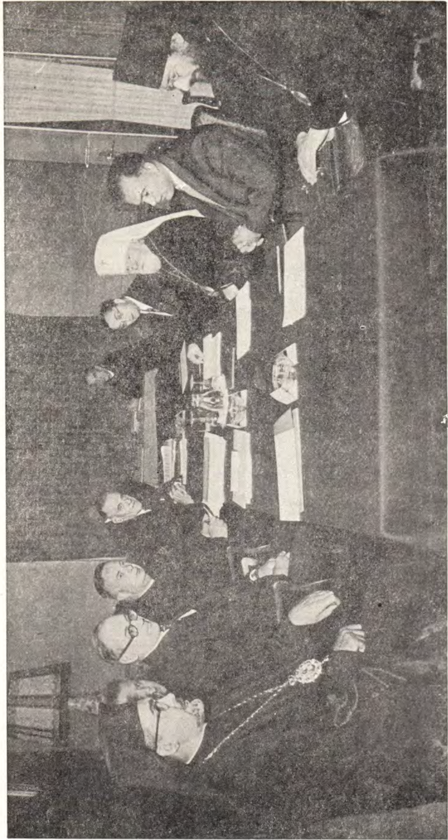
ЗАСЕДАНИЕ ПРЕДСТАВИТЕЛЕЙ РУССКОЙ ПРАВОСЛАВНОЙ ЦЕРКВИ И ВСЕМИРНОГО СОВЕТА ЦЕРКВЕЙ