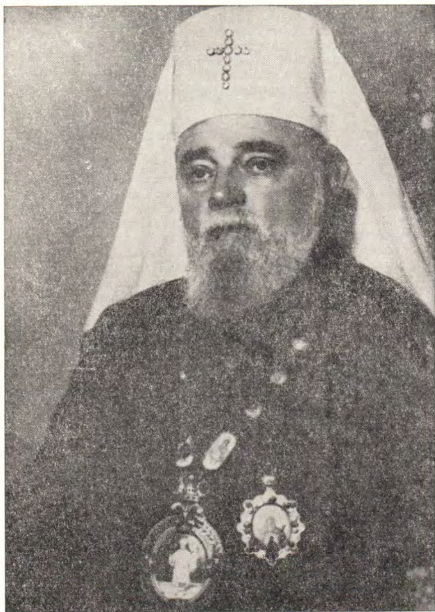
СВЯТЕЙШИЙ ВИКЕНТИЙ, ПАТРИАРХ СЕРБСКИЙ