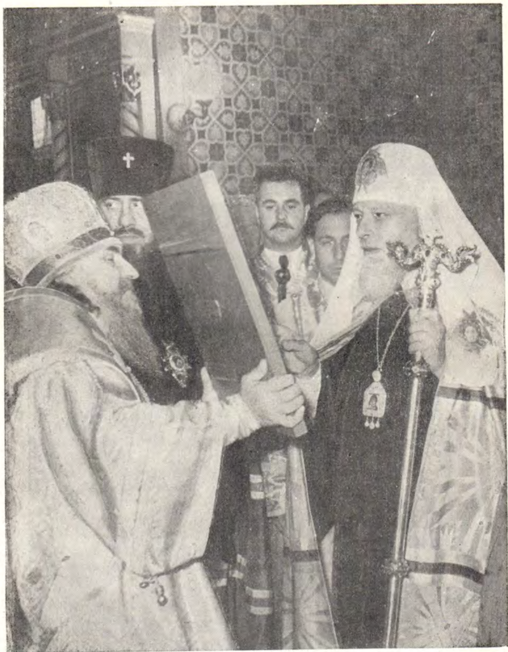
АРХИЕПИСКОП НЕКТАРИЙ ПОДНОСИТ ИКОНУ СВЯТЕЙШЕМУ ПАТРИАРХУ АЛЕКСИЮ В КАФЕДРАЛЬНОМ СОБОРЕ г. КИШИНЕВА