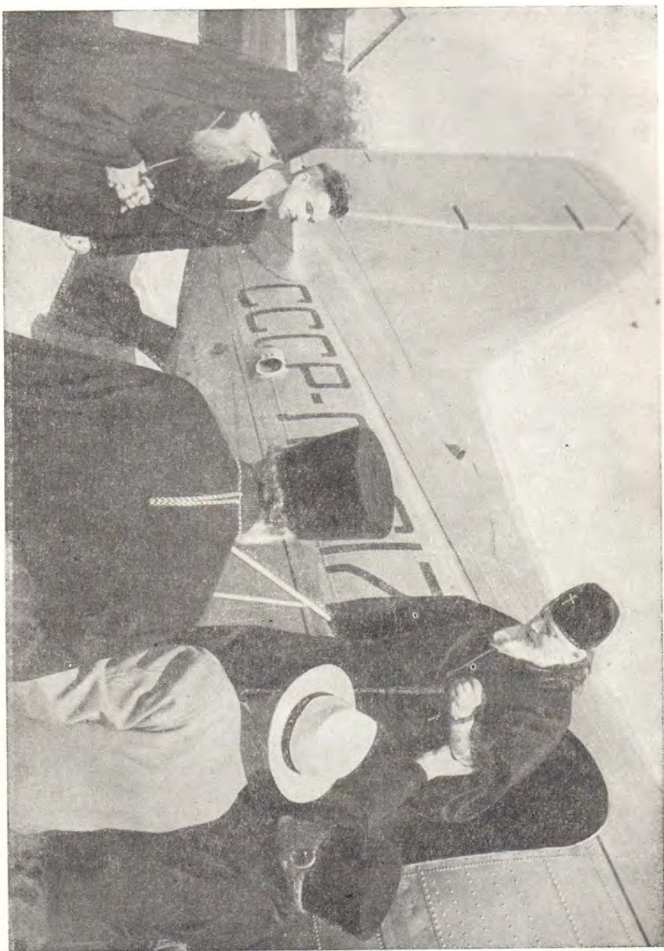
ПРИБЫТИЕ СВЯТЕЙШЕГО ПАТРИАРХА АЛЕКСИЯ НА АЭРОДРОМ В КИШИНЕВЕ