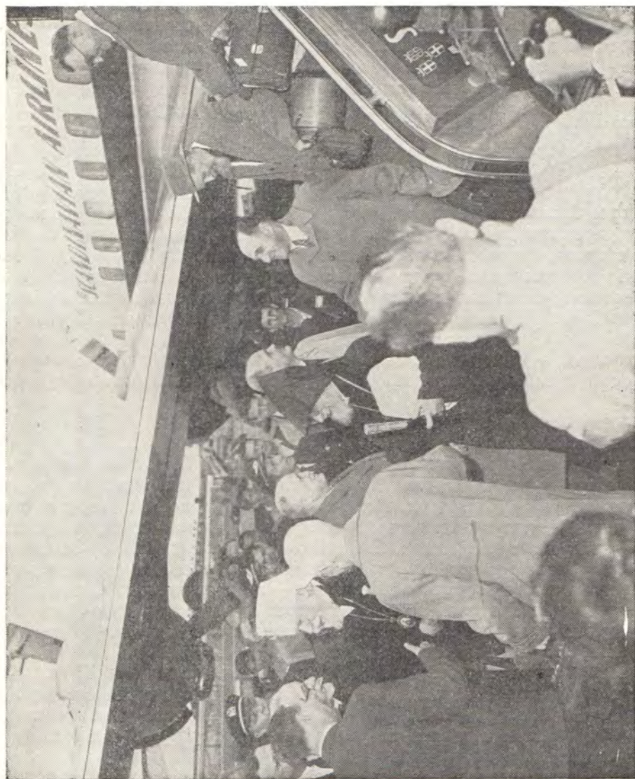
ПРИБЫТИЕ ДЕЛЕГАЦИИ НА АЭРОПОРТ В НЬЮ-ЙОРКЕ