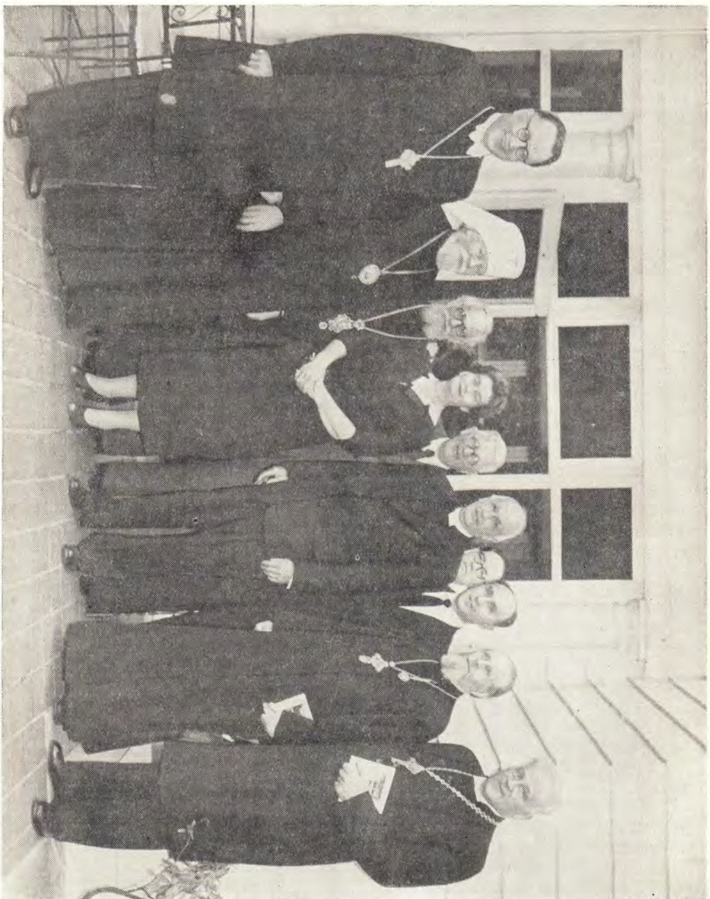
ДЕЛЕГАЦИЯ В ГОСТЯХ У ГЛАВЫ ЕПИСКОПАЛЬНОЙ ЦЕРКВИ В США ЕПИСКОПА ШЕРИЛЛА