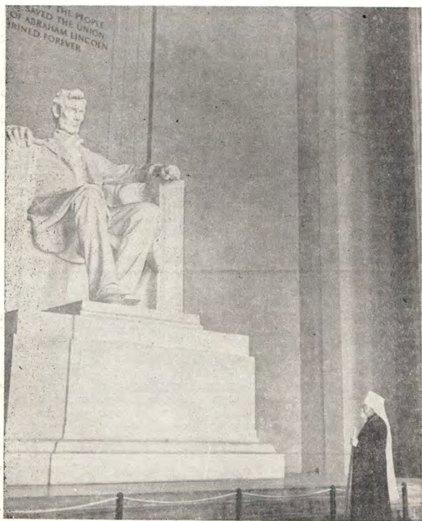
У ПАМЯТНИКА ЛИНКОЛЬНУ В Г. ВАШИНГТОНЕ