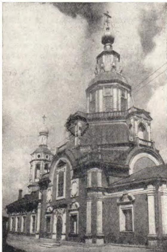
ХРАМ ВО ИМЯ СВ. ИОАННА ВОИНА, ЧТО НА ЯКИМАНКЕ В г. МОСКВЕ

мыла низменный болотистый берег, и церковь Иоанна Воина дважды в год затопляли полые воды, причиняя разрушения и без того не имевшему достаточно рачительного попечения со стороны новопоселенцев храму. В 1709 году Петр I приезжал в Москву для устройства народных торжеств и возведения триумфальных ворот по случаю Полтавской победы. Проезжая в Лучниках мимо старой запущенной церковки, царь сказал своим спутникам: «Вот Бог даровал нам победу, а церковь Иоанна Воина, столь почитаемого воинством, остается в небрежении!»