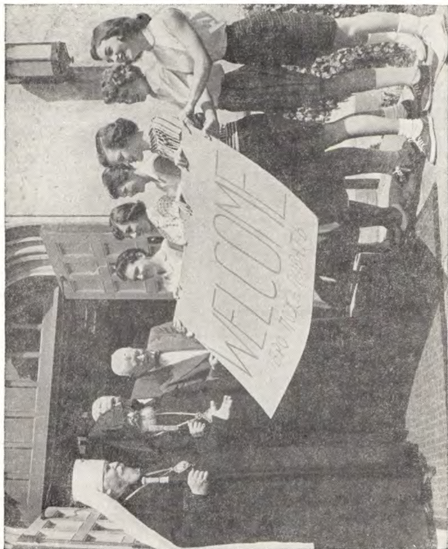
СТУДЕНТКИ ПРИВЕТСТВУЮТ ДЕЛЕГАЦИЮ В Г. ВУСПЕРЕ