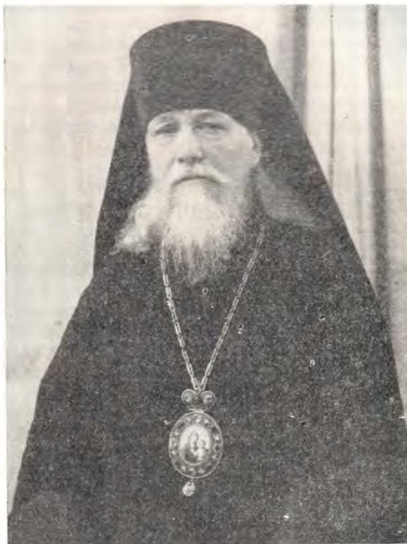
СЕРГИЙ, ЕПИСКОП НОВОРОССИЙСКИЙ

При вручении новопоставленному епископу архиерейского жезла Святейший Алексей произнес речь, напечатанную ниже.