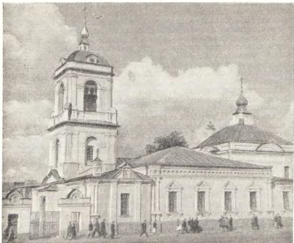
КАФЕДРАЛЬНЫЙ ХРАМ НА ПРЕОБРАЖЕНСКОЙ ПЛОЩАДИ В МОСКВЕ