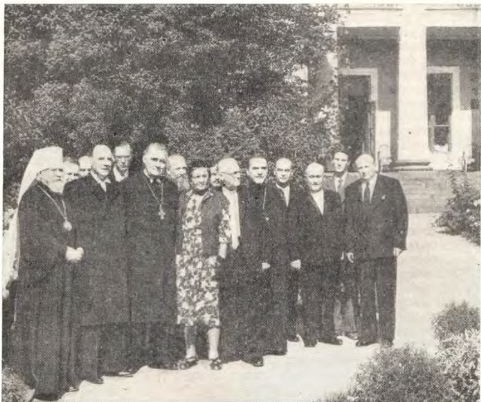
ЦЕРКОВНЫЕ ГОСТИ ИЗ ЗАПАДНОЙ ГЕРМАНИИ В САДУ ПАТРИАРШЕЙ РЕЗИДЕНЦИИ В МОСКВЕ