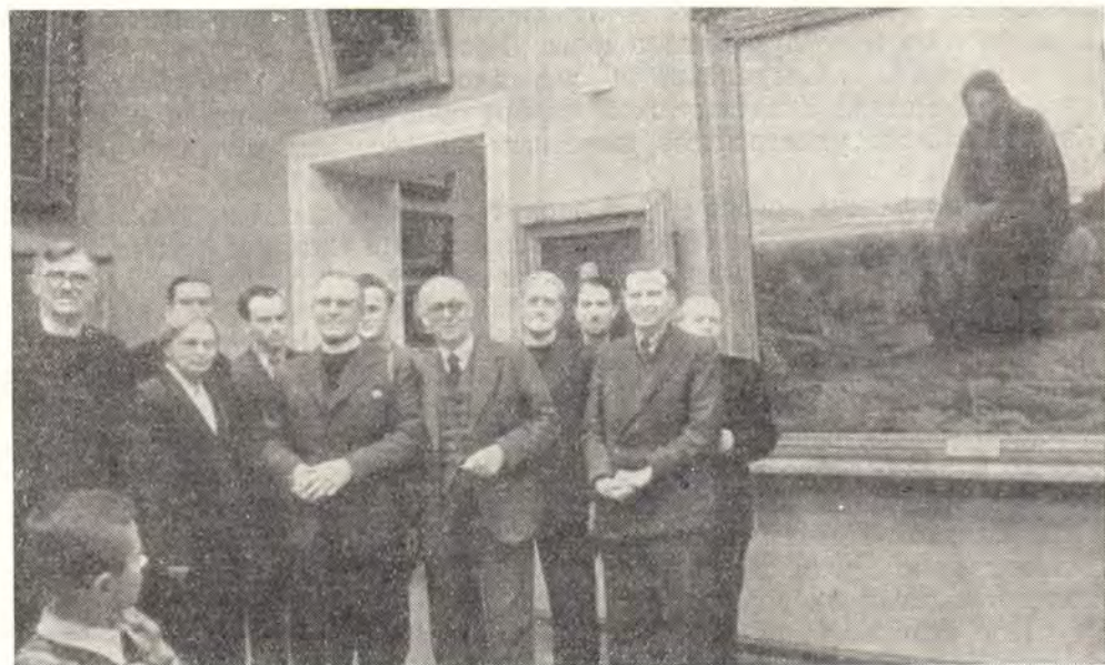
ДЕЛЕГАЦИЯ ЦЕРКОВНЫХ ДЕЯТЕЛЕЙ АНГЛИИ В ТРЕТЬЯКОВСКОЙ ГАЛЛЕРЕЕ

Митрополит Николай, приветствуя гостей, как носителей доброй воли к установлению взаимопонимания, выразил надежду на то, что их