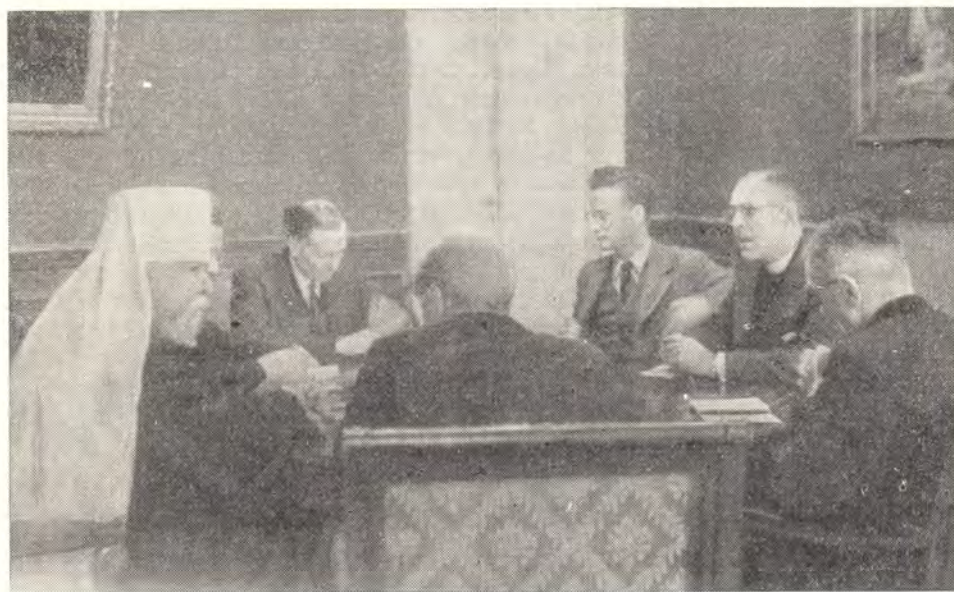
ДЕЛЕГАЦИЯ ЦЕРКОВНЫХ ДЕЯТЕЛЕЙ АНГЛИИ НА ПРИЕМЕ У МИТРОПОЛИТА НИКОЛАЯ

В целях широкого ознакомления с церковной жизнью Советского Союза делегация посетила католические храмы Москвы и Ленинграда