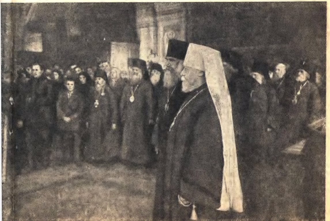
Сделанная по Святейшему Патриархе Сергию, совершенной в присутствии Собора епископов (см. 5 стр.).