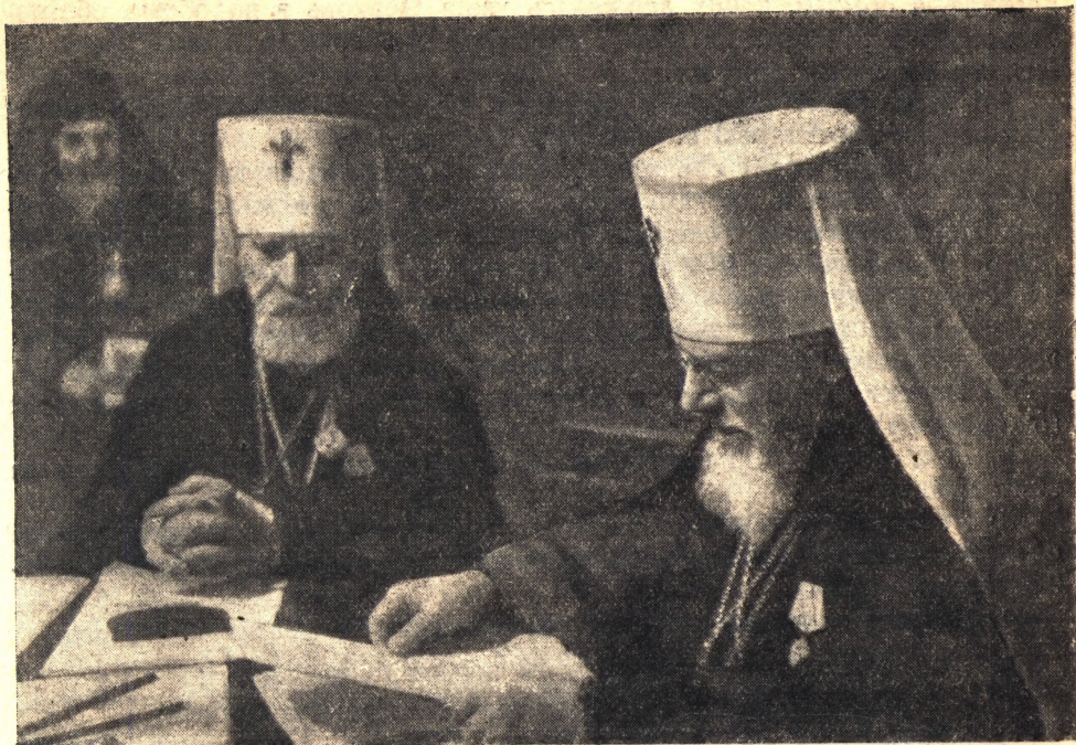
Патриарший Местоблюститель Митрополит Алексей (справа) и Митрополит Николай во время заседания Собора Епископов

блюдается во многих местах и у многих пастырей; о долге нашем в этом отношении быть живыми и назидательными примерами для пастырей, чтобы с надлежащим авторитетом руководить ими,— об этом, я уверен, каждый из нас заботится и, в меру ревности своей и стремления, успевает.