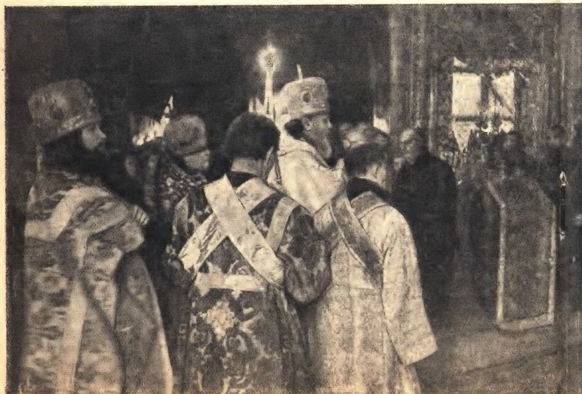
1. Заседание Собора епископов. 2. Митрополит Алексей произносит речь перед панихидой по